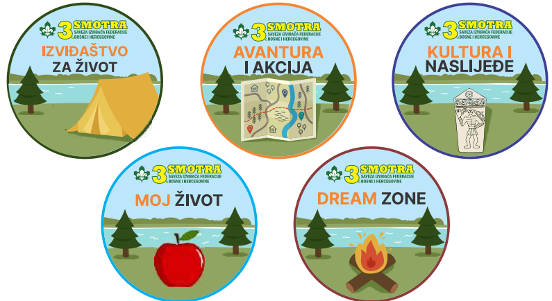
AMBLEMI PROGRAMSKIH AKTIVNOSTI